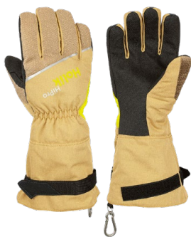
Maris Long Beige